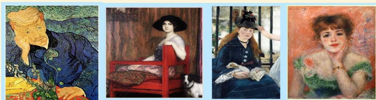
Vincent van Gogh, Dr. Gachet Ram

De Waterman Edouard Manet werkt met een mentale, lichte en afstandelijkere expressie dan de Vissen Pierre Auguste Renoir. Bij Renoir's schilderijen lijkt het of je door een waterspiegel heen kijkt.